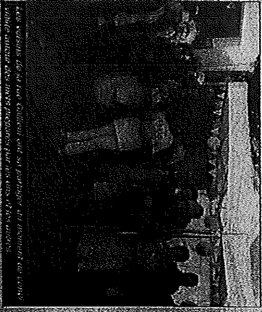
Les voisins de la rue Gallieni sont en train de discuter au cours d'une soirée lors de la Fête des voisins.

A la résidence d'Autonne. Dans le cadre de la Fête des voisins, l'opération «Maison de retraite en l'air» aura lieu au sein de la résidence d'Autonne. Chaque édition de la Fête des voisins a pour thème «Maison de retraite en l'air». Un thème qui implique pleinement tous les habitants de la résidence. Les voisins se retrouvent pour discuter de leur vie, de leurs projets, de leurs expériences, de leurs connaissances, de leurs compétences, de leurs passions, de leurs hobbies, de leurs animaux, de leurs voyages, de leurs découvertes, de leurs rencontres, de leurs amis, de leurs familles, de leurs enfants, de leurs petits-enfants, de leurs neveux, de leurs nièces, de leurs cousins, de leurs tantes, de leurs oncles, de leurs grands-parents, de leurs arrière-grands-parents, de leurs amis d'enfance, de leurs amis d'adolescence, de leurs amis d'université, de leurs amis de travail, de leurs amis de voisinage, de leurs amis de quartier, de leurs amis de ville, de leurs amis de province, de leurs amis de France, de leurs amis de l'étranger, de leurs amis de tous les pays, de leurs amis de tous les continents, de leurs amis de toute la planète, de leurs amis de toute l'humanité, de leurs amis de toute la vie.