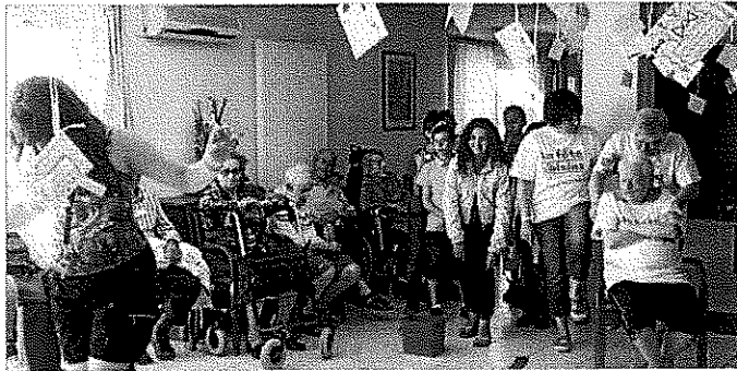
A Gigean on n'est pas en reste quand il faut faire la fête.

La Colombe, maison de retraite de Gigean, a célébré la fête des voisins, fin mai. Pour la troisième année consécutive, l'établissement participe à cet événement créateur de lien social. Porteuse de valeurs de proximité, de citoyenneté et de solidarité, la fête des voisins avait pour thème, cette année, l'activité physique en maison de retraite.