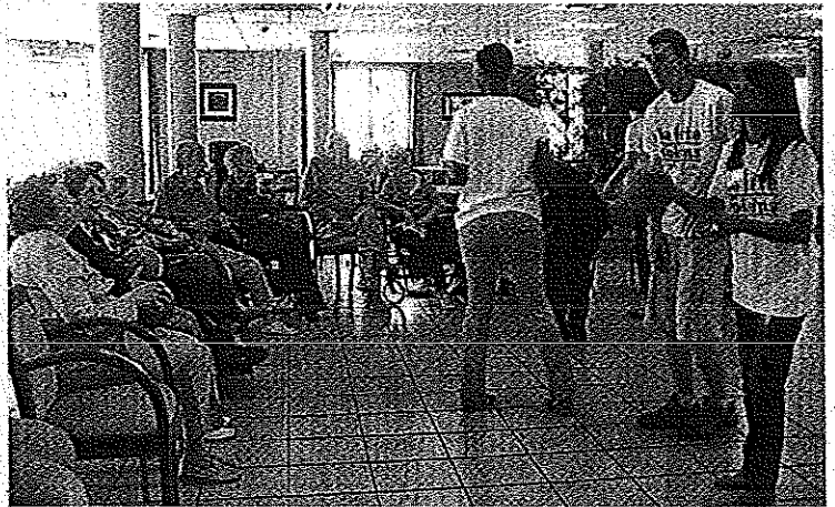
Une fête des voisins placée sur le thème de la gym à la maison de retraite.

La résidence d'Automne, gérée par le groupe Medica s'est associée à la fête des voisins pour la troisième année consécutive. Thème central retenu: l'activité physique en maison de retraite. À ce titre, familles, voisins, écoliers du parrain'âge Sur le Chemin de l'école et résidants ont partagé de beaux moments. Les activités étaient conduites par SIEL Bleu, premier réseau national de prévention santé par l'activité physique pour les personnes âgées. « Les générations se sont réunies dans un esprit